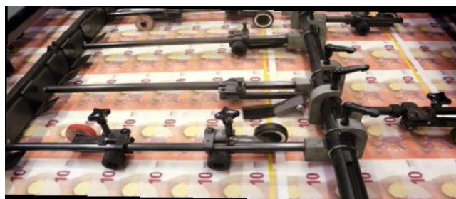
Le billet de 10€ est sur les rails !