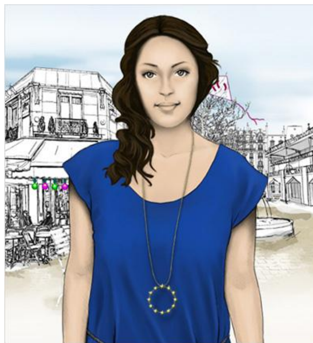
EURO CASH ACADEMY

Explorez les signes de sécurité grâce au module interactif Euro Cash Academy disponible sous ce lien et téléchargeable sur smartphone.